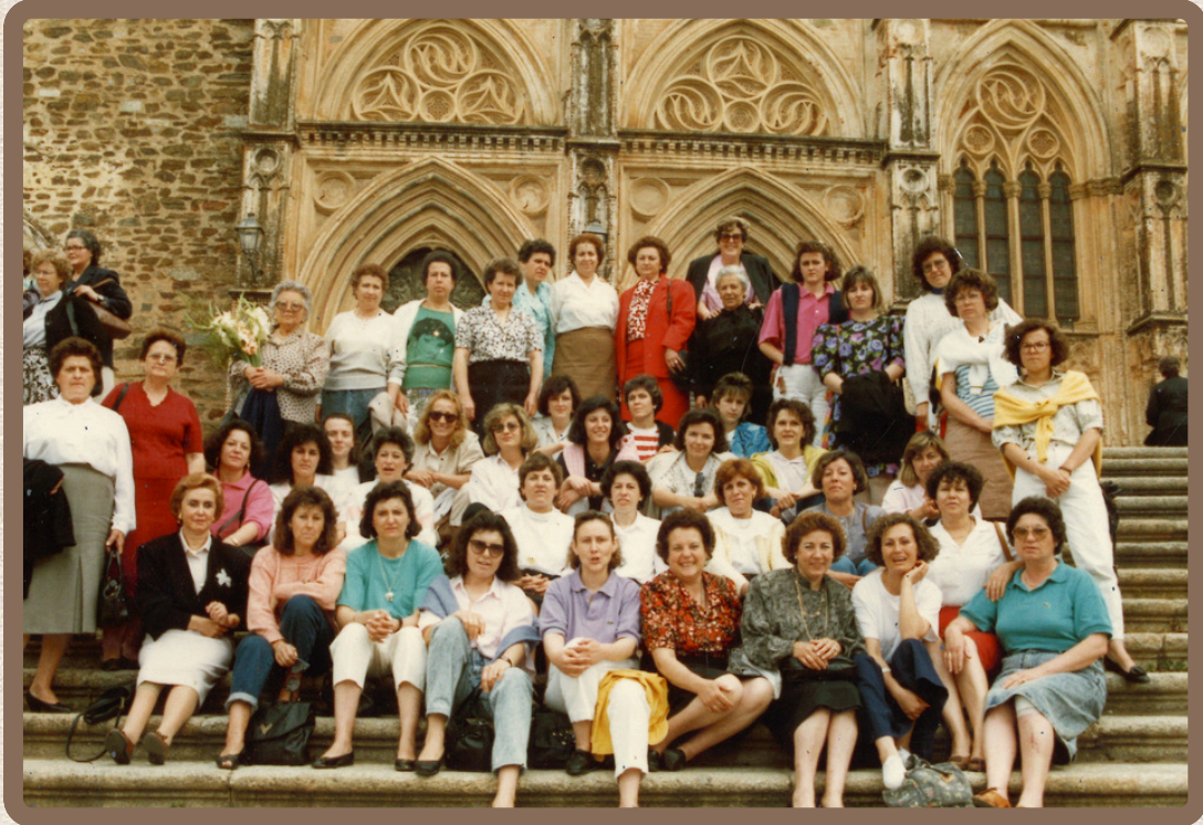
Asociación Carolina Coronado en Guadalupe