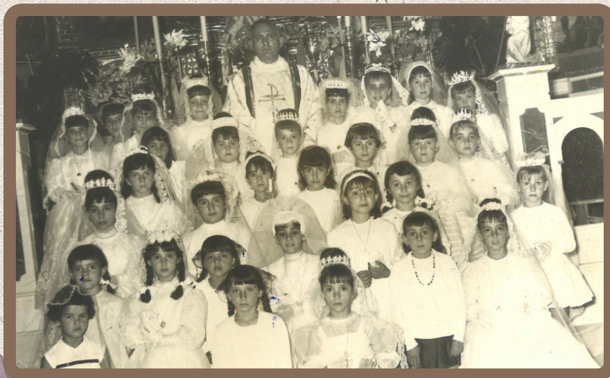
1965. Grupo de Comunion