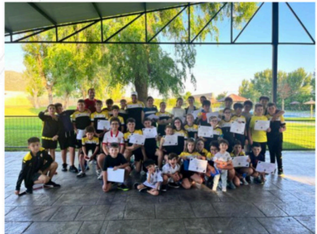
CLAUSURA ESCUELA DE TENIS