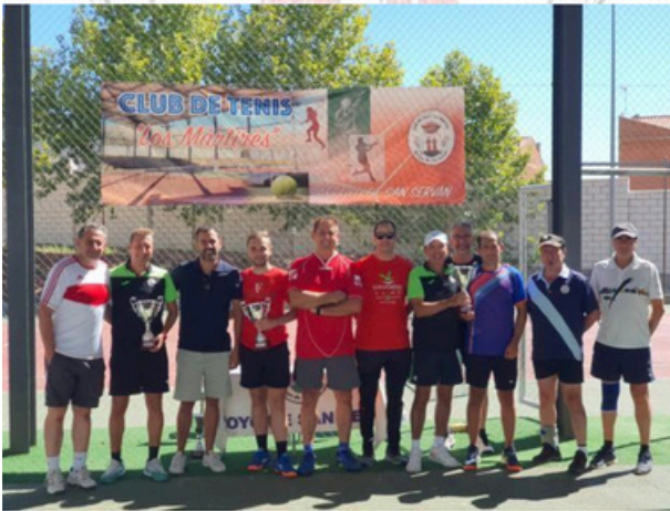
I TORNEO DOBLES ANTONIO BENÍTEZ